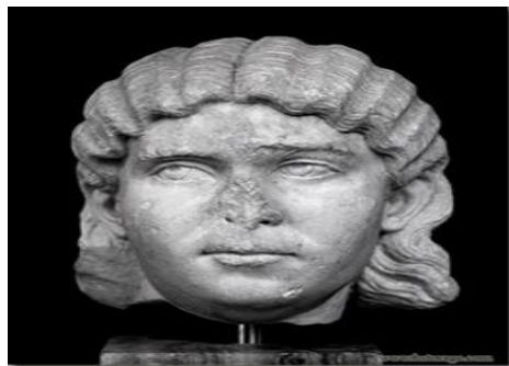
Figure n° 8 : Otacilia Severa