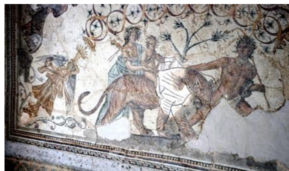
Figure N° 3 : Détail Domptage des fauves