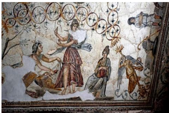
Figure N° 4 : Détail Scène d'initiation