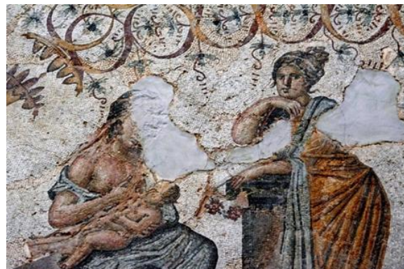
Figure N° 2 : Détail Scène d'allaitement

Les scènes (représentant des femmes) qui nous intéressent, dans cette présente étude, sont quatre en plus des quatre victoires qui décorent les angles du pavement :