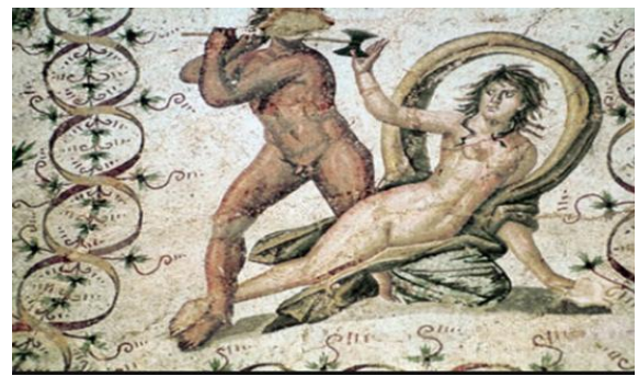
Figure N° 5. Le Châtiment de Lycurgue

Devant la scène du meurtre de la nymphe Ambrosia par Lycurgue , nous sommes face à un « dévêtir » plus qu'à un vêtement dont il ne reste qu'une partie de couleur bleue enroulée autour de la jambe gauche (la tunique ou la palla ). À cela s'ajoute une partie du manteau qui s'arrondit derrière elle et qui paraît bicolore (jaune et bleu). Le nu d' Ambrosia est dépourvu de toute connotation sexuelle que l'on retrouve chez les ménades ou les nymphes, il recèle plutôt une connotation magique (la transformation en vigne) et menaçante (le meurtre de la nymphe).