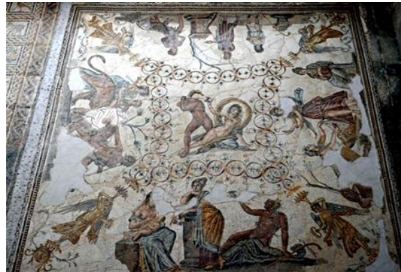
Figure N° 1. Mosaïque dionysiaque de Cuicul-Djemila.

Cet article n'est que le début d'une étude sur le costume féminin à travers les mosaïques romano-africaines, dont deux pavements que nous présentons dans le présent travail, provenant de colonies fondées par Nerva, situées à une cinquantaine de kilomètres l'une de l'autre, la première en Numidie « Cuicul » et la seconde en Maurétanie Sétifienne « Sitifis ». Le point commun entre les deux pavements, en plus du domaine de la mythologie à laquelle ils appartiennent, est l'ambiance dionysiaque dans laquelle ils baignent tous deux, même si un siècle les sépare.