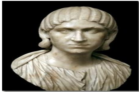
Figure n° 7. Julia Mamaea

Elle est coiffée à la mode Sévérienne (fin IIIe) à la Julia Mamaea (mère de Sévère Alexandre ) (Figure 7) ou comme Otacia (épouse de Philippe l'Arabe ) (Figure 8). Les cheveux sont finement crantés en bandeaux plats jusqu'à la nuque et devaient finir par derrière en un chignon plat.