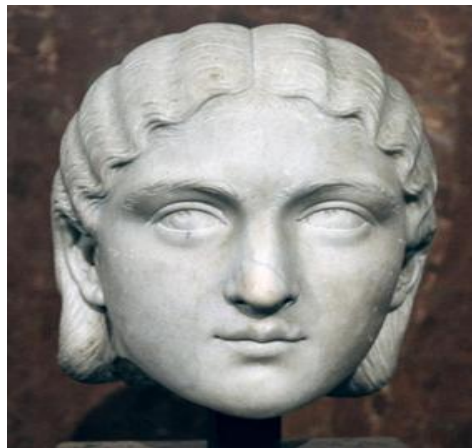
Figure n° 9 :Orbiana

Les cheveux sont crantés en bandeaux ondulés suivant la coiffure d' Orbiana épouse d' Alexandre Sévère (Figure 9), et une couronne dorée est posée devant une natte, bien que la coiffure ait été jugée par Donderer 25 comme la plus tardive du début de l'IV e .